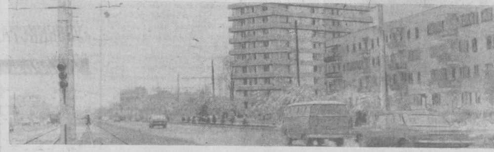
ТАШКЕНТ, УЛ. ЛАХУТИ.