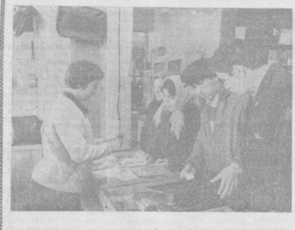
Новые виды обслуживания населения внедряет коллектив книжного магазина № 3 «Прогресс», что находится по улице Ново-Московской. Передвинные киоски от магазина часто организуют книжные торговые в ТашМИ, на эскизавторном и лакокрасочном заводах, а также в школах.