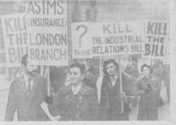
ЛОНДОН. По всей Англии проходит волна массовых забастовок, демонстраций и митингов против антирабочего законопроекта консерваторов, лишаящего трудящихся прав на забастовки. Более ста муниципальных служащих Лондона направились в центр английской столицы — к фондовой бирже, где состоялся большой митинг протеста против антирабочего законодательства. НА СНИМКЕ: демонстрация муниципальных служащих в Лондоне. Символ из английской газеты «Морнинг стар».

ВАШИНГТОН. В конгрессе США растет движение за сокращение дорогостоящих военных обязательств Вашингтона за границей и использование высвободившихся средств для удовлетворения насущных внутренних потребностей страны. Сенатор-демократ Э. Холлингс высказался за возвращение домой, по крайней мере, половины контингента американских войск, расквартированных в Западной Европе. Наши обязательства за рубежом, отметил он, превышают наши возможности. Наступило время, подчеркнул сенатор, пересмотреть первоочередность наших задач и сделать «возможно больший упор» на внутренние нужды.