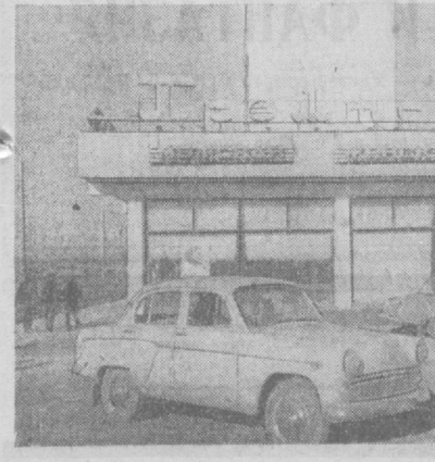
ТАШКЕНТ СЕГОДНЯ. Промтоварный магазин в микрорайоне Ц-5.

Углубление в республиканской Центральной лаборатории хлебопечения внедрили на таджикских хлебозаводах № 1 и № 3 этот препарат. Ежедневно предприятия выпускают 100—120 тонн хлеба с «Ореанином».