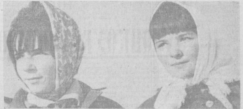
Ознамовать XXIV съезд КПСС высшими показателями в труде — таково стремление инструкторов управления Ташмострой треста «Ташсельманш» своей поместью в жизнь, подруги выполняли дневное задание на 120—140 процентов.