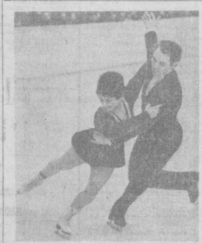
НА СНИМКЕ: сильнейшие фигуристы Европы и мира в парном катании Ирина Роднина и Алексей Уланов. Этим они победили на соревнованиях в Цюрихе.

Так, если допустим, двое судей отзвонились последним местом, это не повлияет на результат, так как большинство судей — пять человек — считают спортсмена сильнейшим. У этого фигуриста будет не максимальная сумма мест и, возможно, не наибольшая сумма баллов — это обстоятельство всегда вымывает недоумение болельщиков, но он все-таки будет победителем. Таким же образом вычисляются вторые, третьи и последующие места.