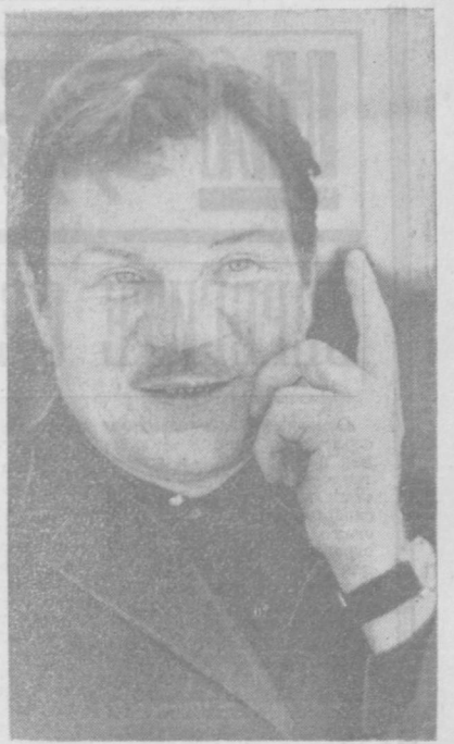
Встречи для вас