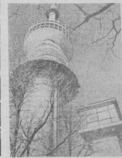
К концу этого года в Пече, на юге Венгрии, будет завершено строительство телевизионной башни. Вполне возможно, что приход нового 1972 года многие жители города захотят отпраздновать здесь, в кафе «Эспрессо» на высоте 72 метров. Панорамой родных мест они будут любоваться с высоты 77 метров.