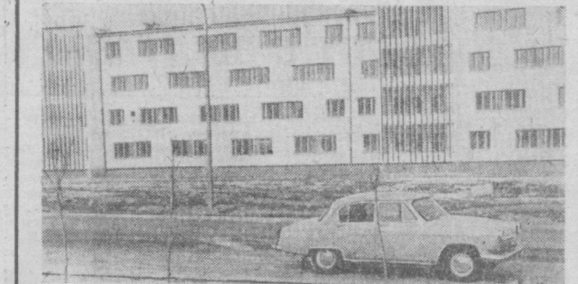
В микрорайоне Ц-6 города строятся четыре жилых кооперативных дома. НА СНИМКЕ: новый жилой кооперативный дом, который скоро будет сдан в эксплуатацию.

Институтом животноводства Министерства сельского хозяйства Узбекской ССР путем отбора создан улучшенный сорт кукурузы «Имеретинский гибрид». Урожай зеленой массы с опилочных участков составляет 600—700 центнеров с гектара, зерна — 40—45. Экспериментальная база института «Красный водопад» выращивает кукурузу «Имеретинский гибрид» на семенном и ежегодном реализует их в другие хозяйства нашей республики и за ее пределами. Путем массовой селекции создан и сорт скороспелого сорта, получивший название «Чилин». Сорт районирован по республике. Ежегодно семена сорто передаются совхозам республики, а также отправляются в Туркмению и Таджикистан для дальнейшего их районирования. Институтом создан высокоурожайный и выносливый сорт джугары «Игант Узбекистана», который районирован по республикам Средней Азии и Южного Казахстана. Также на государственное сортоиспытание приняты 2 новых сорта джугары на зерно «Узбекская-2» и «Кларн Узбекистана». Семена новых высокоурожайных сортов кукурузы, джугары и сорго пользуются спросом как в соседних братских республиках, так и за рубежом (Афганистан, Гвинея, Сомали, Иран, Болгария, Югославия).