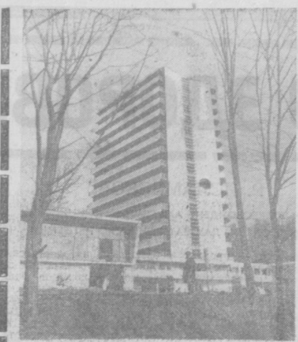
Всесезонный курорт Сочи пополнился еще одной здравницей. Завершено строительство санаторного комплекса «Анжер».