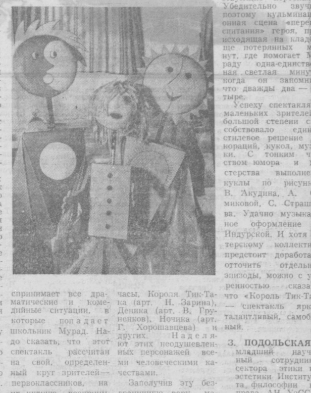
Спектакль «Король Тик-Так»

Республиканский театр кукол показал своим маленьким зрителям новый спектакль — «Король Тик-Так». Эта пьеса, написанная детским поэтом, ташкентцем Я. Ходжаевым, привлекла внимание постановщика И. Якубова и всего политехнического коллектива своей новизной, широким простором для творческой фантазии и, в известной степени, — нетрадиционностью. Совершив «прорыв» через обиходный привычный мир «звериной» тематики, где прочно царствуют поросята, утята, волки и лисы, театр вывел на подмостки героев и заботам школьного зрителя.