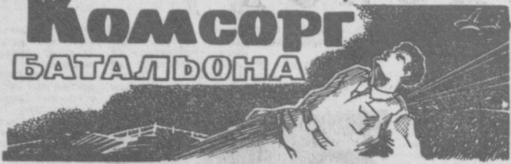
Отрывок из повести