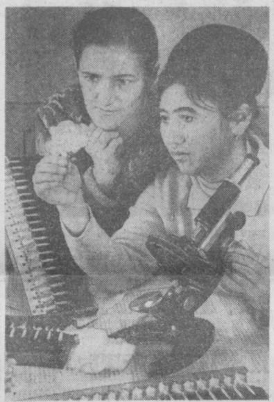
В ЛАБОРАТОРИИ КОЛХОЗА

Такие же универмаги в нынешнем году появятся и в ряде других районов Каракалпакской Автономной республики.