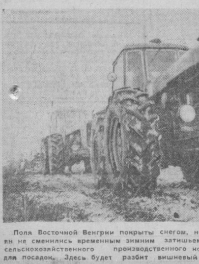
Поля Восточной Венгрии покрыты снегом, но трудовые будни крестьян не сменились временным затишьем. Члены Кишунского сельскохозяйственного производственного кооператива готовят почву для посевов. Здесь будет разбит вишневый сад.

ских, фильмов, чем в Италию, Францию, Испанию, несмотря на то, что в Бразилию в три-четыре раза меньше кинолент, чем в указанные страны. За период с 1960 по 1967 годы бразильским зрителям было показано более 20 тысяч зарубежных картин. Засилье иностранных кинокомпаний на бразильском рынке наносит серьезный ущерб развитию национальному киноискусству. Местный кинематограф из-за отсутствия собственной промышленной базы не выдерживает конкуренции с иностранными компаниями. Острой проблемой остается и высокая стоимость ввозимых фильмов. Чтобы пойти в кино, необходимо заплатить один доллар, что равно чуть ли не дневной зарплате, которую получают сотни тысяч простых бразильцев.