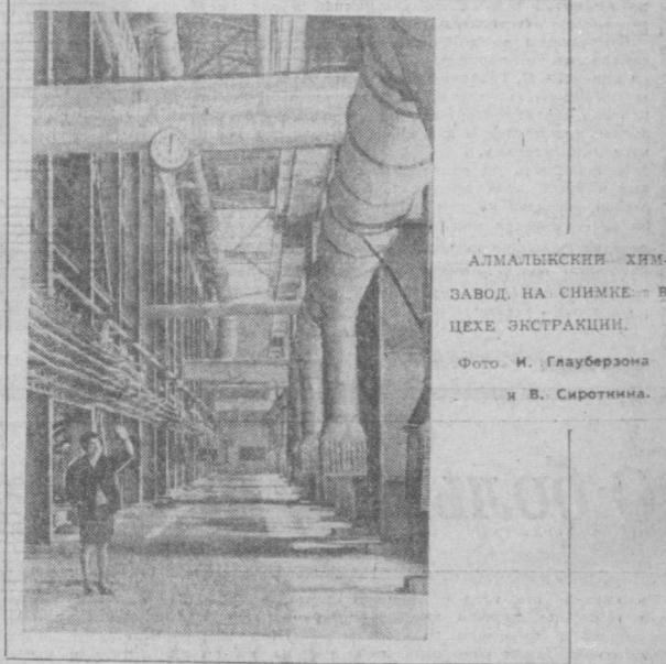
АТМАЛЫКСКИЙ ХИМЗАВОД НА СНИМКЕ — В ЦЕХЕ ЭКСТРАКЦИИ.

Кроме того, сотрудники института составили документацию по совершенствованию технологии производства асфальто-бетонных смесей.