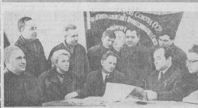
НА СНИМКЕ: группа инженерно-технических работников ордена Трудового Красного Знамени обсуждает проект Директивы XXIV съезда КПСС.

— Наша партия, весь советский народ, — сказал докладчик, — готовится к заманчивому, историческому событию в жизни нашей страны — XXIV съезду КПСС. Съезд поделит итоги работы партии и народа за истекшее время, определит новые задачи коммунистического строительства, утвердит Директиву развития народного хозяйства страны на 1971—1975 годы. С чувством глубокой удовлетворенности и большой гордости за нашу Родину встретили трудящиеся области, как и все советские люди, проект Директивы XXIV съезда КПСС по пятилетнему плану развития народного хозяйства СССР на 1971—1975 годы. Это документ огромной политической и государственной важности. В нем определены основные направления экономического развития страны на новую пятилетку. Под руководством партии наша Родина за прошедшую пятилетку сделала новый крупный шаг в социальном, экономическом развитии, в повышении благосостояния народа, в подъеме науки и культуры, в дальнейшем укреплении оборонного могущества. Проведена большая работа по осуществлению новой экономической реформы, совершенствованию планирования и экономического стимулирования, ускорению научно-технического прогресса, оснащению народного хозяйства современной техникой. Жизнь полностью подтвердила правильность экономической политики партии и действительность практических мер Центрального Комитета по ее осуществлению.