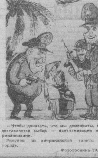
— Чтобы доказать, что мы демократы, вам предоставляется выбор — ветшизация или американизация.

Женщины, и особенно цветные, подчеркивается в статье, постоянно подвергаются унижениям, их вынуждают брать работу, которую не оставили бы делать нанятого мужчину.