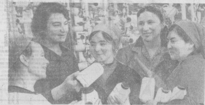
Коллектив трикотажной фирмы, став на ударную вахту в честь XXIV съезда КПСС, успешно выполняет задание девятой пятилетки. В каждом цехе много передовиков труда, которые уже работают в счет 1972 года. Таких десятки. Застрельщиками в соревновании — коммунисты и комсомольцы ветераны производства.

Редакция газеты обращается ко всем своим читателям, партийным, советским, профсоюзным, комсомольским работникам, передовикам производства, всем труженикам столицы Узбекистана с предложением принять участие в обсуждении проекта Директив XXIV съезда КПСС.