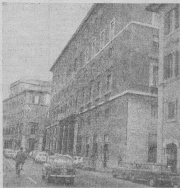
ИТАЛИЯ. НА СНИМКЕ: здание ЦК Итальянской коммунистической партии в Риме.

На студии документальных и научно-популярных фильмов Узбекистана закончен монтаж оборудования для обработки цветной пленки. Установка новой машины заняла около года. Со сдачей ее в эксплуатацию появится возможность обрабатывать пленку как со студии Средней Азии.