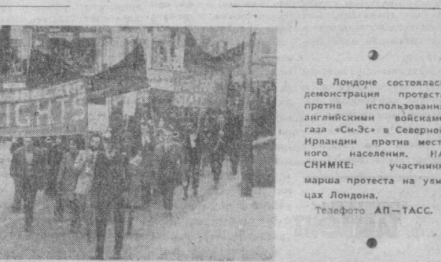
В Лондоне состоялась демонстрация протеста против использования английскими войсками газа «Си-Эс» в Северной Ирландии против местного населения. НА СНИМКЕ: участники марша протеста на улицах Лондона.

приспешниками бандитские методы: поджоги, взрывы бомб, нападения на должностных лиц разоблачили в глазах всего мира подлинное лицо воинствующего сионизма. ◆ ЛУСАКА. (ТАСС). Девятки автолюбителей ревель, снесенные мосты и размытые дороги, разрушенные дома и