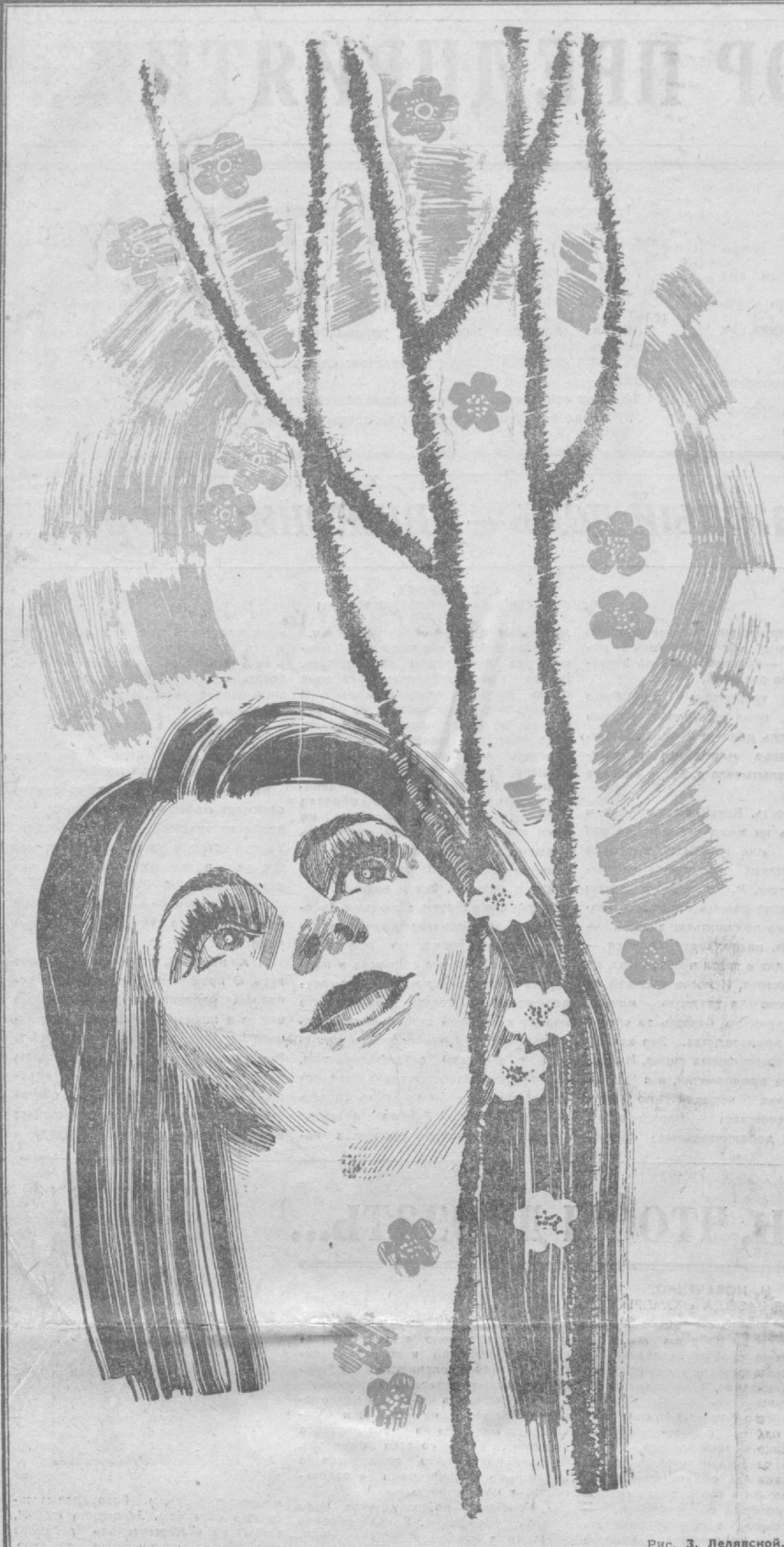
Рис. З. Лелявской.

ЦЕНТРАЛЬНЫЙ КОМИТЕТ КОММУНИСТИЧЕСКОЙ ПАРТИИ СОВЕТСКОГО СОЮЗА.