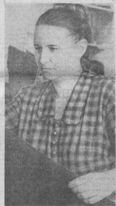
Фирма «Красная Заря» является одним из ведущих предприятий легкой промышленности столицы Узбекистана. Швейники были инициаторами соревнования за досрочное выполнение плана восьмой пятилетки. Коллектив фирмы взял обязательство план первого квартала этого года выполнить досрочно.

И. РОЛЬНИК, главный специалист Госстроя УзССР.