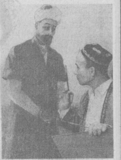
П пишу портрет