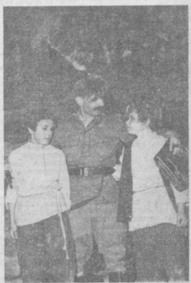
Чувство меры ни в