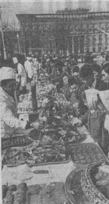
Более двухсот выставочно-распродажных куликарных и нондирективных изданий, а также полуфабрикатов организовал в нынешнем году ташкентский трест ресторанов. Такие выставки устраиваются в каждую пятницу и субботу на центральных площадях города. Богатый ассортимент продуктов питания привлекает горожан.

Генеральный секретарь ЦК КПСС тов. Л. И. Брежнев встретился с находящимися в отпуске в Советском Союзе Первым секретарем ЦК СЕПГ, Председателем Государственного совета Германской Демократической Республики тов. В. Ульбрихтом. Встреча прошла в обстановке сердечности и дружбы.