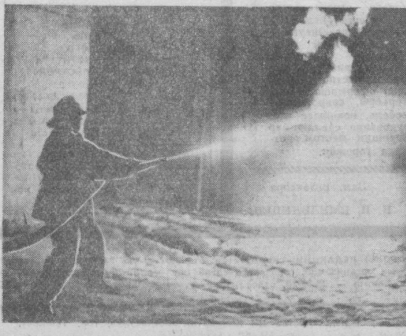
БОРЬБА С ОГНЕМ НАЧАЛАСЬ...