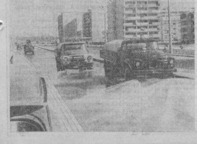
Сейчас городская автодормехбаза располагает мощной техникой. С ее помощью ташкентские улицы можно сделать образцовыми. На страже чистоты стоит 100 поливомоечных машин.

Сегодня рабочие и служащие фарфорозавода вышли на субботник. 150 человек приняли активное участие в озеленении и благоустройстве территории предприятия и близлежащих улиц. Полностью очищены рынки, общая длина которых составляет два километра. Высажено 1.800 кустарников, много декоративных и фруктовых деревьев.