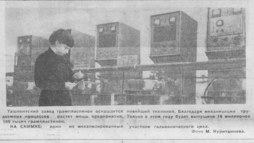
Ташкентский завод грампластинок оснащается новейшей техникой. Благодаря механизации трудоемких процессов растет мощь предприятия. Только в этом году будет выпущено 16 миллионов 100 тысяч грампластинок.

При проектировании и строительстве сохранив и колхозных поселков намечены широкие использование и органическое сочетание лучших достижений современной архитектуры с традициями народного зодчества.