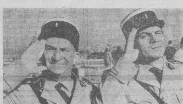
СОВЕТСКИЕ зрители уже давно знакомы с ярким и многогранным дарованием великого французского комического актера Луи де Фюнеса. В своих многочисленных ролях Фюнес стремится как бы вскрыть истинное

С ОВЕТСКИЕ зрители уже давно знакомы с ярким и многогранным дарованием великого французского комического актера Луи де Фюнеса. В своих многочисленных ролях Фюнес стремится как бы вскрыть истинное