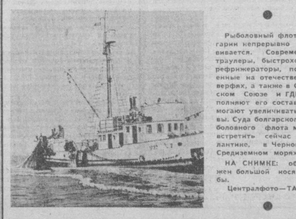
Рыболовный флот Болгарии непрерывно развивается. Современные траулеры, быстроходные рефрижераторы, построенные на отечественных верфях, а также в Советском Союзе и ГДР, пополняют его состав и помогают увеличивать уловы. Судя болгарского рыболовного флота можно встретить сейчас в Атлантике, в Черном и Средиземном морях.