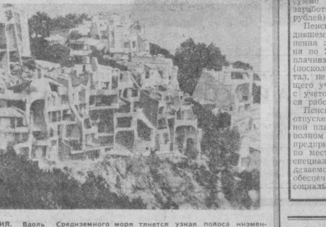
Ф РАНЦИЯ. Вдоль Средиземного моря тянется узкая полоса низменности с вечнозеленой растительностью. У подножия подступающих к морскому побережью Альп расположены курорты Лазурного берега. Недалеко на скалах пурпурно-красного цвета между местечками Теул и Ла Напул выросло любопытное селение (на снимке).

На выставке в специальном оборудованном зале демонстрируются советские документальные фильмы о Москве и Подмосковье.