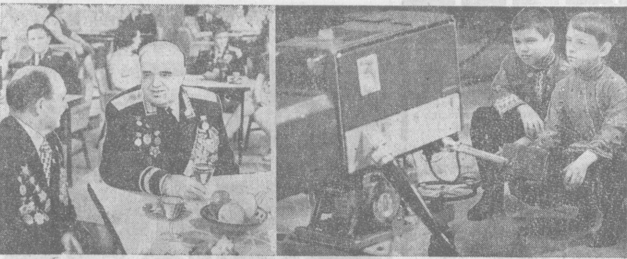
Центральное телевидение готовит к юбилейным майским дням праздничные программы. Зрители увидят на экране популярных артистов театра и кино, познакомятся с героями Великой Отечественной войны, узнают, как сложились их судьбы в мирное время, каких успехов добились они в труде и творчестве.

Яркая исполнительская манера артиста, тонкость и глубина проникновения в музыкальные образы надолго запомнятся ташкентцам.