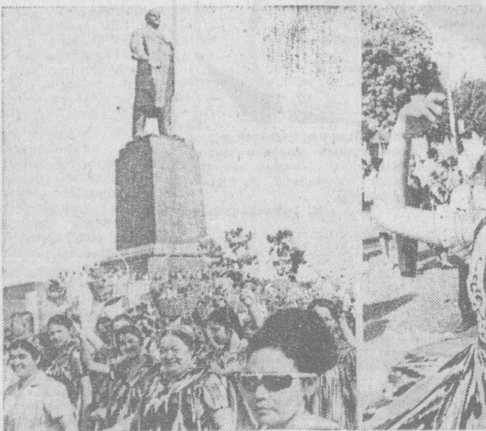
НА СНИМКАХ: в праздничных колоннах.