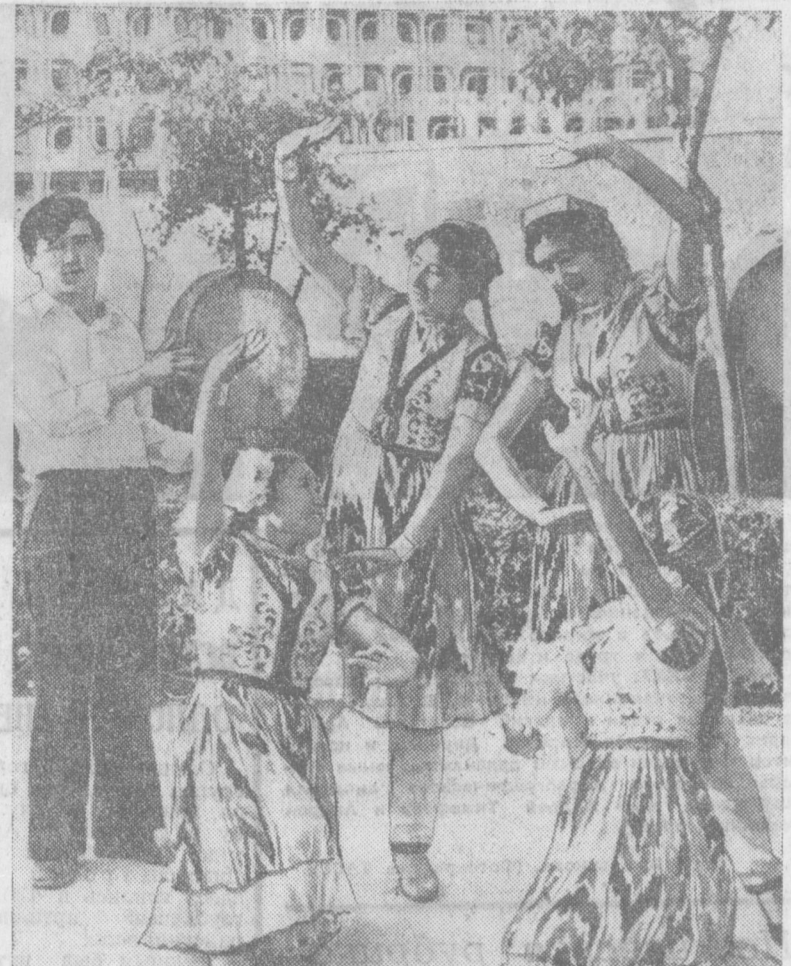
К празднованию 30-летия Победы советского народа в Великой Отечественной войне многие коллективы художественной самодеятельности подготовили обширные концертные программы, с которыми в дни праздника выступали в парках, на улицах и площадях города. Разнообразные национальные танцы покажет ташкентцам ансамбль песни и танца «Баёт» Дома культуры № 3 Октябрьского района. НА СНИМКЕ: участники ансамбля исполняют узбекский народный танец.

Очень мне понравился Ташкент! Чистый, зеленый, с красивыми, даже уникальными современными зданиями, с замечательными памятниками старины. В эти праздничные дни вспоминаю об Узбекистане и его жителях с особой теплотой. Читателям газеты «Вечерний Ташкент» наши самые сердечные поздравления с наступающим праздником. С благодарностью летчик-космонавт СССР Виктор Горбатко