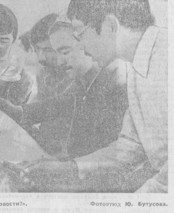
«Какие сегодня новости?». Фотохуд Ю. Бутусова.

«Вся жизнь в цветах» «Радуга» В Московском швейном объединении «Радуга» началось изготовление изделий весенне-летнего ассортимента. В 1975 году коллектив выпустил 2 миллиона 300 тысяч женских, мужских и детских плащей. По сравнению с прошлым годом производство возросло в два с лишним раза увеличился выпуск продукции, удостоенной государственного Знака качества. Все весенние новинки отмечены почетным ленточным знаком «Радуга» охватил выпуск еще 27 новых моделей плащей. Сувениры из хрусталя Выпуск новой продукции начал коллектив Киевского завода художественного стекла — одного из старейших предприятий Украины. Среди новинок — нарядные вазы из хрусталя, оригинальной формы сосуды из цветного стекла, сувениры, конфетницы, статуэтки. С начала года завод отправил в магазины хрустальной посуды на полмиллиона рублей больше, чем за тот же период прошлого года. Костюмы со Знаком качества Восьми моделям костюмов для мальчиков и платьев для девочек, выпускаемых Ленинканской швейной фабрикой имени Чкалова, присвоен государственный Знак качества. Теперь с почетным ленточным знаком изготавливаются 18 видов продукции. Здесь постоянно расширяют ассортимент, заботятся о том, чтобы одежда была современной, высококачественной. На фабрике проводятся конкурсы на лучшую модель сезона, изучается спрос населения. С начала года на фабрике было внедрено 15 единиц оборудования, что позволило дополнительно освоить на сто тысяч рублей сверхплановую продукцию со Знаком качества. (Корр. ТАСС).