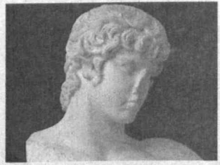
Манбага кўра, ўзини танитишни хоҳламаган милли-

Рим императори Адриана (эрамиздан аввалги 138-117 йиллар)нинг севилгани Антониянинг мрамартошдан ясалган бюсти Нью-Йоркдаги "Sotheby's" аукционидида жуда қиммат нархда сотилди.