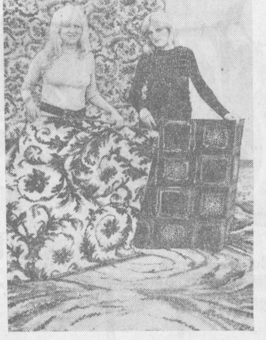
ПОЛЬША. Около одного миллиона квадратных метров ковров отправит на экспорт в нынешнем году коллектив фабрики «Ковары». Один из крупнейших покупателей — Советский Союз. Ковры польских мастеров пользуются большим спросом в Голландии, Иране, Иране и других странах. НА СНИМКЕ: работницы фабрики демонстрируют новую продукцию.

всестороннего экономического и научно-технического сотрудничества двух стран. В настоящее время оно осуществляется между 33 советскими и 14 чехословацкими министерствами и научно-исследовательскими учреждениями. Около двух тысяч научных и технических проблем Чехословакия решает совместно с СССР и другими странами-членами СЭВ.