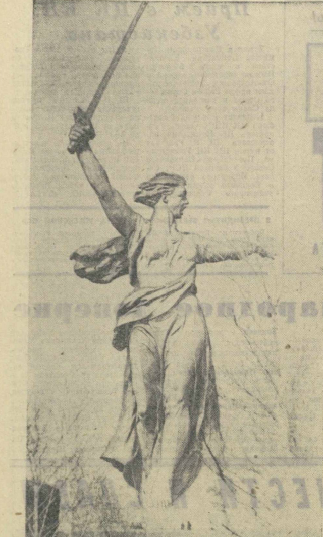
МАТЬ-РОДИНА. Главный монумент памятника-ансамбля на Мамаевом кургане в Волгограде.

В городе проводилась большая агитационно-пропагандистская работа. Было организовано 175 агитационных бригад, действовавших в Ташкенте, в окрестностях города, в селах и деревнях.