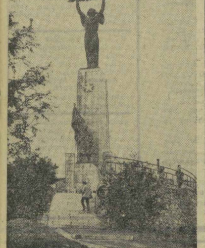
▲ БУДАПЕШТ. Монумент Освобождения на Гора Геллерт. На цоколе памятника вырезаны имена советских героев, которые отдали свою жизнь в боях за венгерскую столицу.