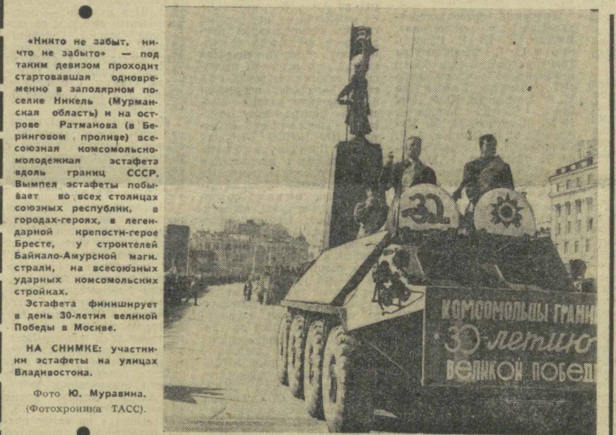
НА СНИМКЕ: участники эстафеты на улицах Владивостока.

НА СНИМКЕ: защитники Москвы.