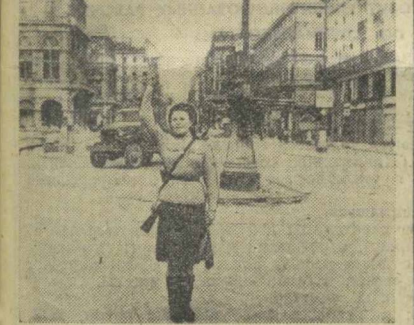
▲ ВЕНА. Снимок военного времени. Девушка-боец Советской Армии регулирует движение у здания венской оперы.