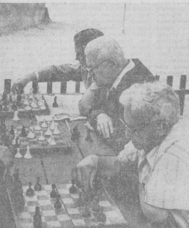
Какой вариант лучше?