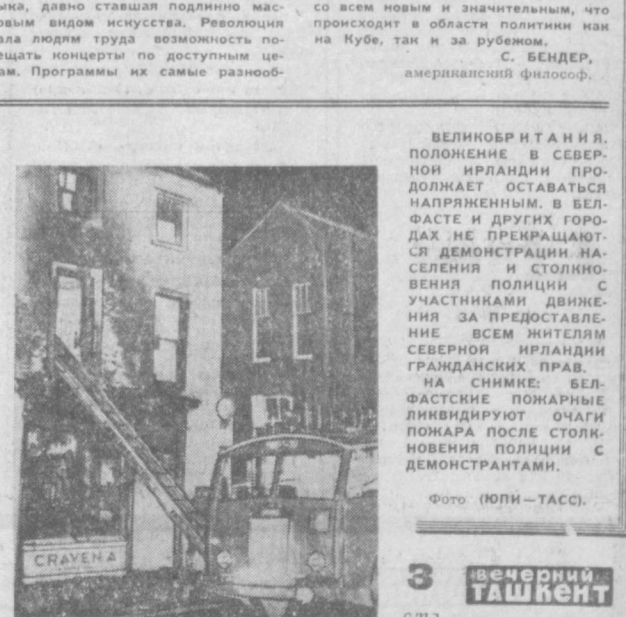
ВЕЛИКОБРИТАНИИ. ПОЛОЖЕНИЕ В СЕВЕРНОЙ ИРЛАНДИИ ПРОДОЛЖАЕТ ОСТАВАТЬСЯ НАПРЯЖЕННЫМ. В БЕЛФАСТЕ И ДРУГИХ ГОРОДАХ НЕ ПРЕКРАЩАЮТСЯ ДЕМОНСТРАЦИИ НАСЕЛЕНИЯ И СТОЛКОВЕНИЯ ПОЛИЦИИ С УЧАСТНИКАМИ ДВИЖЕНИЯ ЗА ПРЕДОСТАВЛЕНИЕ ВСЕМ ЖИТЕЛЯМ СЕВЕРНОЙ ИРЛАНДИИ ГРАЖДАНСКИХ ПРАВ. НА СНИМКЕ: БЕЛФАСТСКИЕ ПОЖАРНЫЕ ЛИКВИДИРУЮТ ОЧАГ ПОЖАРА ПОСЛЕ СТОЛКОВЕНИЯ ПОЛИЦИИ С ДЕМОНСТРАНТАМИ.