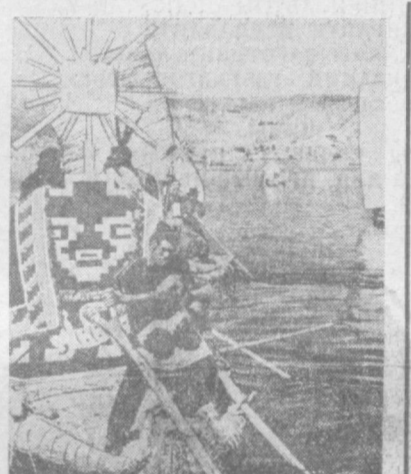
ПЕРУ. Сотни лет назад перуанские индейцы смело выходили в океан на лодках, сделанных из тростника тоторо, ратущего в Южной Америке. И сейчас такие суда можно увидеть на озере Титикака в Перу. НА СНИМКЕ: тростниковые лодки на озере Титикака. Их паруса тоже изготовлены из тоторо.

адь именем В. И. Ленина. В торжественной церемонии открытия площади имени В. И. Ленина принял участие президентский выборщик. Площадь имени В. И. Ленина открыта в честь отмечающейся населением города сорокалетней годовщины коммунистического муниципалитета Амбазак.