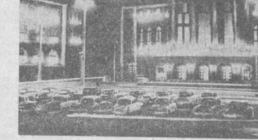
ГДР. Здание оперного театра в Карлмаршштаде.