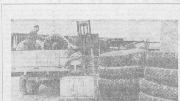
В нынешнем году труженники Ташкентского шинремонтного завода выпустят 45 тысяч шин. НА СНИМКЕ: идет отгрузка готовой продукции завода.