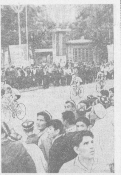
Чем ближе гонщики к долгожданному финишу в Ташкенте, тем острее становится борьба. Никто не хотел рисковать. 1.160 километровую дистанцию они преодолели за 158 часов 11 минут и 53 секунды. В первом месте армяец — 158 часов 26 минут 10 секунд и на третьем — студенты — 159 часов 30 минут 19 секунд.