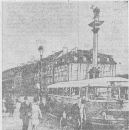
НА СНИМКЕ: вид на улицу в предместье Варшавы.

стных художников, выпускаются знаменитыми хрустальными заводами Богемии. 80 процентов продукции идет на экспорт: хрусталь с маркой «Сделано в ЧССР» продается в 82 странах мира.