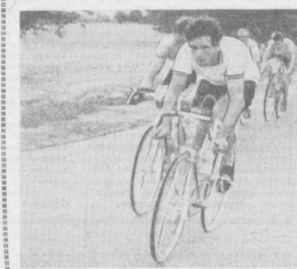
Сразу же после старта гонщики набрали

Г. МАЛИНИН. НА СНИМКАХ: на этапах многодневки.