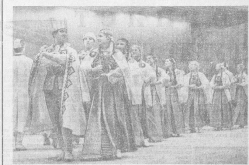
Коллективы художественной самодеятельности Рижского центрального клуба полиграфистов выступают в Латвийской республике. Концерты с участием мужского хора «Данендонс» и танцевального ансамбля «Лиесса» неизменно привлекают большое количество зрителей. Оба коллектива будут представлять Советскую Латвию на всесоюзном смотре самодеятельности, посвященном 100-летию со дня рождения В. И. Ленина.

НА СНИМКЕ: латвийские народные танцы в исполнении «Лиесси».