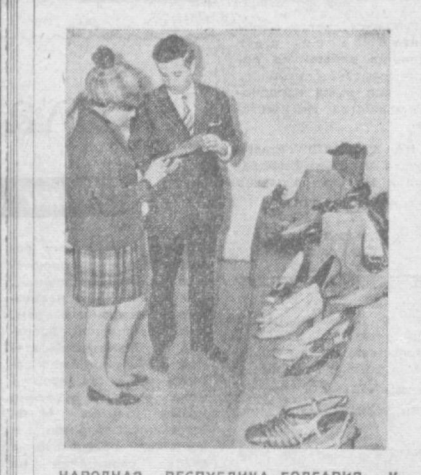
НАРОДНАЯ РЕСПУБЛИКА БОЛГАРИЯ. К весенне-летнему сезону экспериментальная фабрика «Мода» в Софии выпустила много новых фасонов женской и мужской обуви.

С ОФИЯ. Крепнут болгаро-советские экономические связи. В Болгарии с начала года ввезено свыше 150 тысяч тонн консы, 1.500 комбайнов и тракторов, 8.000 легковых и грузовых автомобилей и много другой продукции, сделанной руками советских рабочих. Народная Болгария, в свою очередь, посылает в Советский Союз все возрастающий поток разнообразных товаров своего промышленного и сельскохозяйственного производства.