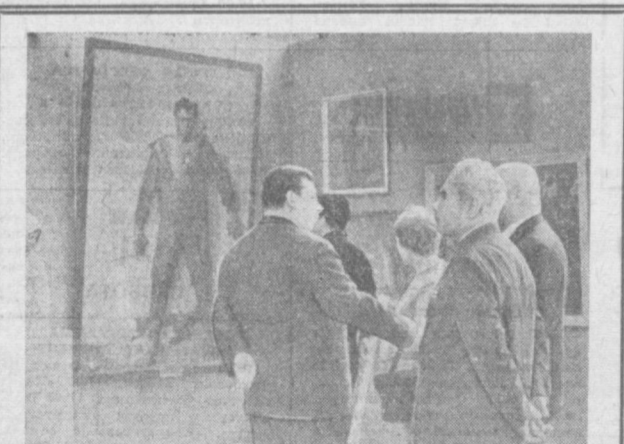
МОСКВА. ЗДЕСЬ ОТКРЫЛАСЬ ВЫСТАВКА ПРОИЗВЕДЕНИЙ МОСКОВСКИХ ХУДОЖНИКОВ — УЧАСТНИКОВ ВЕЛИКОЙ ОТЕЧЕСТВЕННОЙ ВОЙНЫ.

Но, как гласит известная поговорка, ворон ворону глаз не выклюет. В Киле и поныне два мажорных нациста находятся в правительстве. Впрочем, только ли два! Одна из западногерманских газет меланхолически заметила: «Кто знает, сколько коричневых рублей раздается в Шлезвиге-Гольштейне на балтийском ветру?»