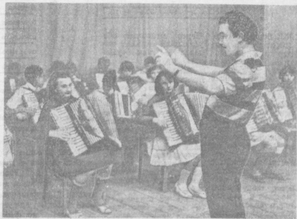
Ансамбль баянистов и аккордеонистов. Солист ансамбля баянист и аккордеонист.

Ансамбль почти полностью состоит из учеников школ города. Они занимаются только в первом классе, другие в выпускном — пятом.