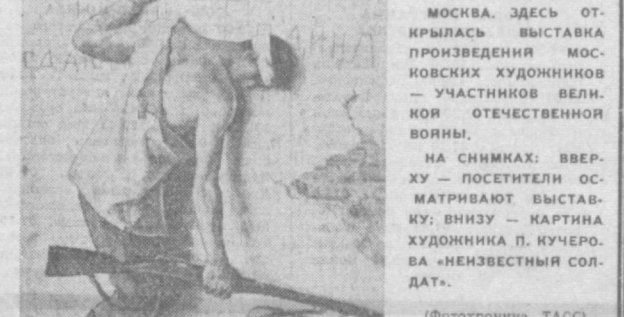
НА СНИМКАХ: ВЕРХУ — ПОСЕТИТЕЛИ ОСМАТРИВАЮТ ВЫСТАВКУ; ВНИЗУ — КАРТИНА ХУДОЖНИКА П. КУЧЕРОВА «НЕИЗВЕСТНЫЙ СОЛДАТ».