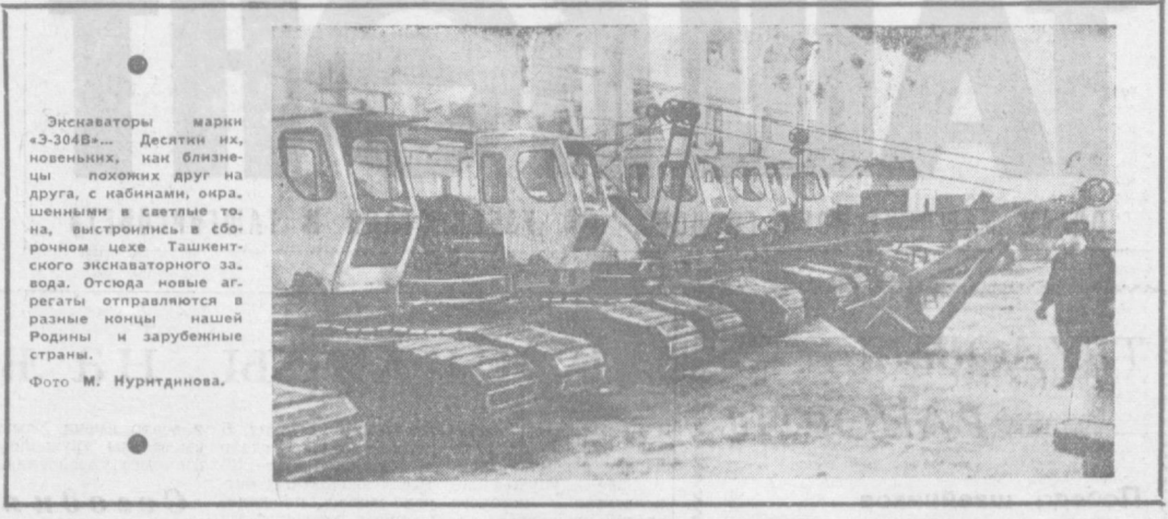
Экскаваторы марки «З-304В»... Десятки их, новейших, как близнецы, лежат друг на друга, с набивками, окрашенными в светлые тона, выстроились в сборочном цехе Ташкентского экскаваторного завода. Отсюда новые агрегаты отправляются в разные концы нашей Родины и зарубежные страны.

в народнохозяйственных планах строительство объектов экскаваторного завода и его филиала. Ташкентский горисполком объявил в третьем квартале этого года отвести Ташкентскому экскаваторному заводу земельные участки в прилегающем к нему районе для строительства общежития, детсада, яслей и профтехучилища с объективом, выделять в 1969—1971 годах по 60 квартир ежегодно для экскаваторного завода. Главаташкентстрою и Министерству монтажных и специальных строительных работ Узбекской ССР поручено закончить строительство и ввести в эксплуатацию в четвертом квартале этого года на экскаваторном заводе главный производственный корпус площадью 10 тысяч квадратных метров и инженерный корпус. Государственный комитет Совета Министров Узбекской ССР по использованию трудовых ресурсов обязан направить в 1969—1970 годах на экскаваторный завод 500 рабочих, из них 300 в этом году. Государственный комитет Совета Министров Узбекской ССР по профессионально-техническому образованию после ввода в эксплуатацию профтехучилища экскаваторного завода должен организовать подготовку в нем квалифицированных рабочих по профессиям.