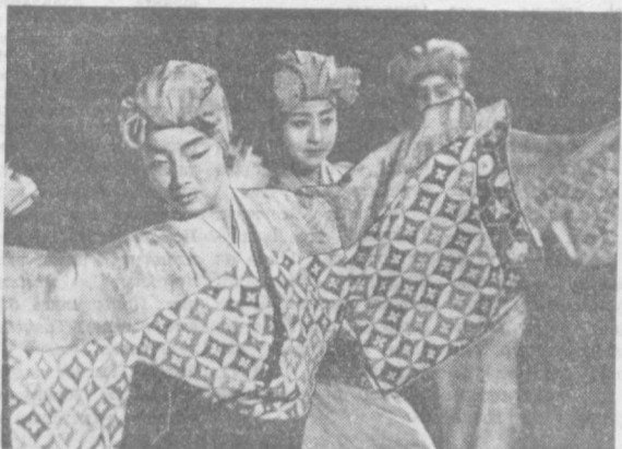
Большой популярностью у зрителей пользуется японская труппа «Одори» (по-русски это слово означает национальные танцы). НА СНИМКЕ: выступают японские танцоры.

Новый мотоциклетный ПРАГА. Началась подготовка и сооружение в предместье Праги нового мотоциклетного завода фирмы «Ява». Строительство предполагается завершить в 1974 году. Новое предприятие будет выпускать в год 100 тысяч спортивных машин, а также запасные части и широко известным во всем мире «Явам». 90 процентов выпускаемых в Чехословакии мотоциклов этой марки идет на экспорт, тем не менее заявки зарубежных заказчиков удовлетворяются не полностью.