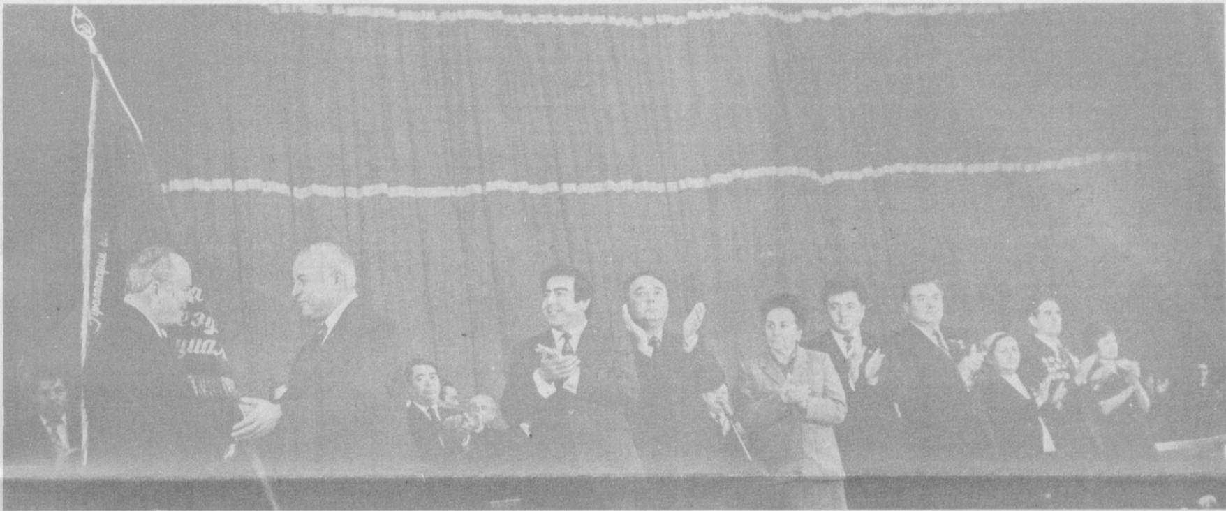
★ Ташкент. 12 марта 1984 года. Вручение Узбекистану переходящего Красного знамени ЦК КПСС, Совета Министров СССР, ВЦСПС и ЦК ВЛКСМ.