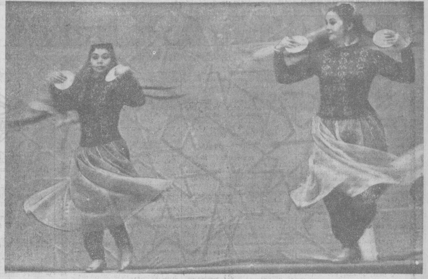
Танец с тарелочками. Исполняет ансамбль «Бахор».

Солдат постоял у печальной раковины, В туманную даль зашагал на заре... Никто не забыт и ничто не забыто На древней и юной советской земле. Отважно сражался мой друг и ровесник И стойко встречал он грохочущий шквал. Но так получилось, что он неизвестным В горящие травы навеки упал. А небо гудело, а поле стояло, Свинцовая вьюга мела и мела. Мать часто о сыне своем тосковала, Его у калитки с надеждой ждала. И грянул победный салют над Москвою, Варяжные стиги везде расцвели. Россия венчала любовью героев — Они от фашизма народы спасли. А годы летели, росли наши дети И сплелись им мирные звездные сны. Однажды в столицу везли на лафете Останки солдата мнувшей войны. И старая мать поспешила из дома, Не раз она знала и грусть, и беду И будто бы встретила сына родного, Погибшего в том сорок первом году. Простилась Москва с неизвестным героем, И всех не вернувшихся видела в нем. И сердце его навсегда молодое Зажглось вдохновенным и вечным огнем. Здесь память дышит гранитные плиты, На страже кремлевские звезды во мгле. Никто не забыт и ничто не забыто На древней и юной советской земле.