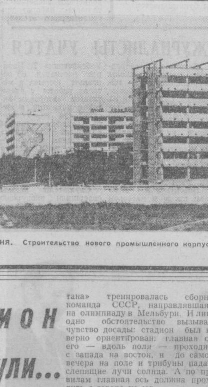
ТАШКЕНТ СЕГОДНЯ. Строительство нового промышленного корпуса на улице Ингельса.

участники совещания, результаты которого, управление общественного питания, многие руководители предприятий не проявляют достаточной заботы об отличной организации работы столовых. Недостаточное внимание к этому делу уделяют и профсоюзные организации. Трудно переоценить роль магазина полуфабрикатов. Он призван облегчить домашние хлопоты женщин. Однако на заводах всего 19 таких магазинов. Да и в их работе не все гладко: зачастую однообразен и беден ассортимент товаров. Участники совещания потребовали от управления общественного питания более настойчиво заниматься улучшением обслуживания производственных коллективов, обобщать и распространять опыт лучших заводских столовых. Цех питания на всех предприятиях города должен работать четко, без перебоев. На совещании с речью выступил секретарь горкома партии Б. Г. Халилов. А. ХАТАМОВ.