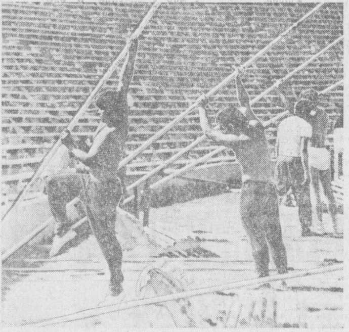
На разминке — прыгуны с шестом.