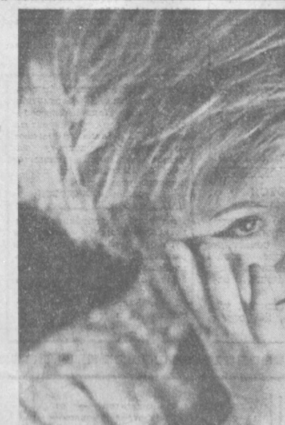
«Я считаю до пяти...»

А. АСЫЛБЕКОВ УЧИТ МУДРАЯ ПРИРОДА Ой, смотрите, стрекоза! Над водой летит скользя, изучаем мы полет, чтоб построить вертолет. За рыбешкою в канале мы в бинокль наблюдали. Хорошо поглядим, и подождем сматерим. У жирафа вы и шею — не найти нигде длиннее! Вот такой длины потом в школе собираем, Над костром уха кишит, Пар колючками летит. Точно так же паровоз Все пыхлет, когда нас вез. Утром песенку скаворце Мы слышали. И мальчишки, и девочки. Тоже петь умеют звонко! Учит мудрая природа нас в любое время года, Наблюдательными быть — Петь, трудиться, мастерить! Перевод с казахского Н. Красильникова.