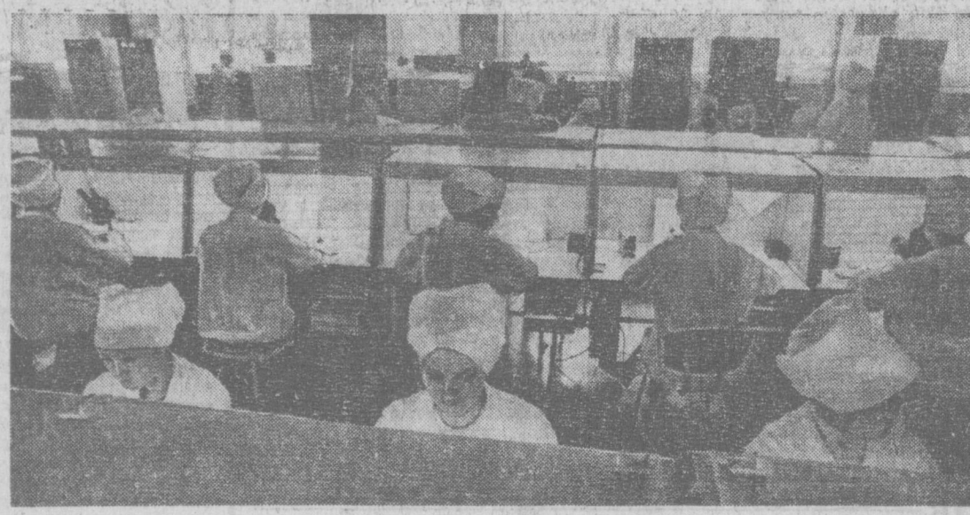
В одном из цехов завода электронной техники имени В. И. Ленина. Фото Г. Пуна, (УзТАД).