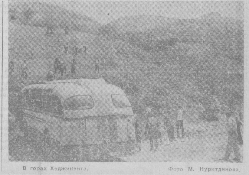
В горах Ходжиметова.