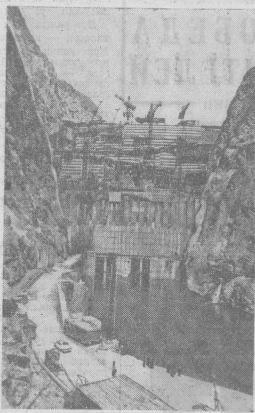
Строители крупнейшей в Киргизии Токтогульской ГЭС встали на трудовую вахту в честь XXV съезда КПСС. Решено в конце нынешнего года закончить возведение высотной плотины гидроузла и монтаж третьего и четвертого агрегатов. Первые два энергоблока станции, мощностью 300 тысяч киловатт каждый, уже дают ток.

Лекторы всесторонне раскрывают созидательную деятельность партии и народа на современном этапе коммунистического строительства, разъясняют права и обязанности граждан, показывают преимущества социалистической избирательной системы перед буржуазной.