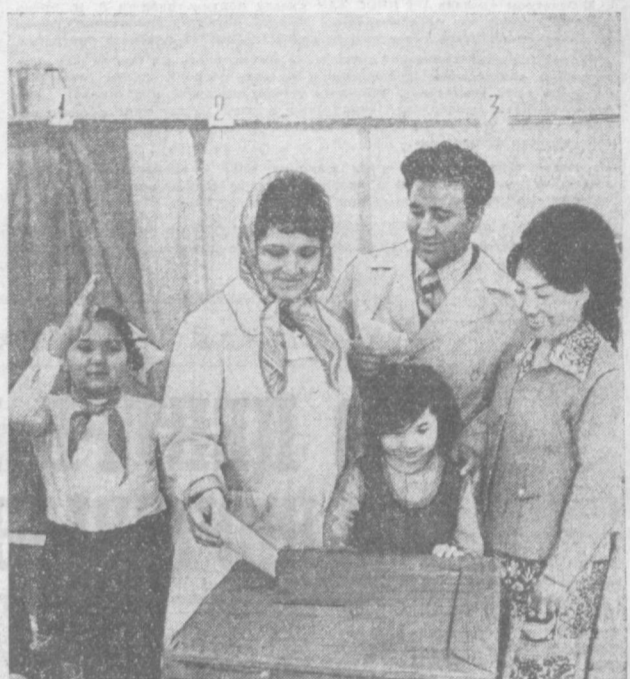
Организовано прошли выборы народных судей в Кировском районе. Одной из первых доложила об окончании голосования избирательница четвертого избирательного участка, расположенного в школе № 9. НА СНИМКЕ: во время голосования.

В коллективе автотранспортного предприятия № 103 треста централизованных перевозок ведется большая работа по повышению коэффициента использования пробега автомашин. С этой целью разрабатываются рациональные маршруты, изыскиваются пути сокращения времени погрузки и разгрузки. Еще недавно автомашины отвозили продукцию Ташкентской обувной фабрики в Сирдарью, а назад шли порожняком. По предложению водителей автотранспортного предприятия, сейчас машины стали загружаться в Чиназе песком для строящихся корпусов обувной фабрики. В результате порожний пробег сократился вдвое. На предприятии разработано около двадцати рациональных маршрутов.