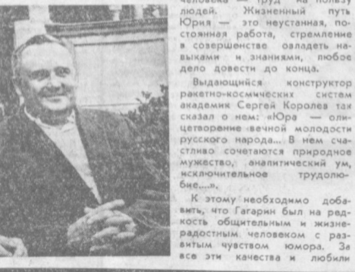
Юрий Гагарин и Сергей Павлович Королев.

Юрия Гагарина называют Колумбом Вселенной. Его полет открыл новую эру освоения космического пространства. За первым полетом чело-