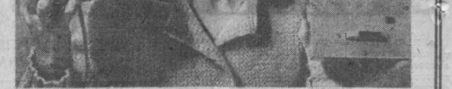
ЛИТОВСКАЯ ССР. На Паневежском электротехническом заводе начались серийное производство оперативного разговора устройства «Гарсас-3». Новый аппарат дает возможность значительно уменьшить нагрузку внутренней телефонной связи.

«Гарсас-3» предназначен для ведения двустороннего разговора между тремя абонентами. Одновременно разговор можно вести между двумя, на пульте третьего загорается лампочка «занято».