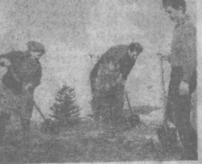
развернуть соревнование за образцовое содержание квартир, дворов, придомовых участков.

ЭТИ дома расположены рядом. Живут в них люди разных профессий. Все они стремятся к тому, чтобы вокруг домов было чисто и уютно. Единодушно поддержали жильцы обращение домового комитета при ЖК № 27: