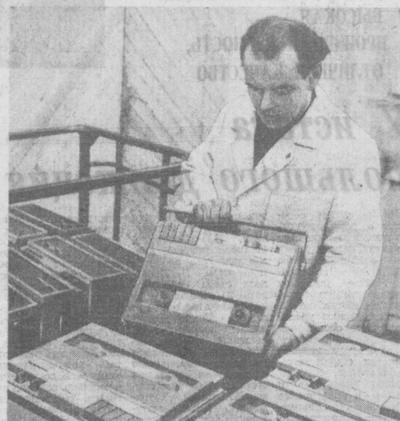
На электротехническом заводе «Эльфа» (Литовская ССР) начато серийное производство магнитофонов «Дайна». Новый магнитофон имеет две скорости, 9,53 и 2,38 сантиметра в секунду. У него современные формы и красивая аншлаш отделка из дерева и пластмассы. В нынешнем году будет выпущено 180 тысяч магнитофонов.

М ЕТОД двойного никелирования, который предложил ученый Литвы, в два-три раза повышает стойкость металлов против коррозии. Это новшество внедряется в автомобильной промышленности. Двойным слоем блестящего никеля, не требующего дополнительной полировки, покрывают, например, детали новой легковой машины «Жигули». Для борьбы с коррозионными литовские ученые стали успешно применять пластмассы. Они, в частности, разработали электрохимический способ покрытия металлов полиэтиленом. Получены также высококачественные немагнитные покрытия, используемые в промышленности.