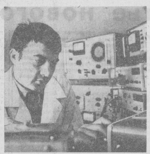
Физ.-техника в ск и а институте АН УзССР. Отдел физики полупроводников.