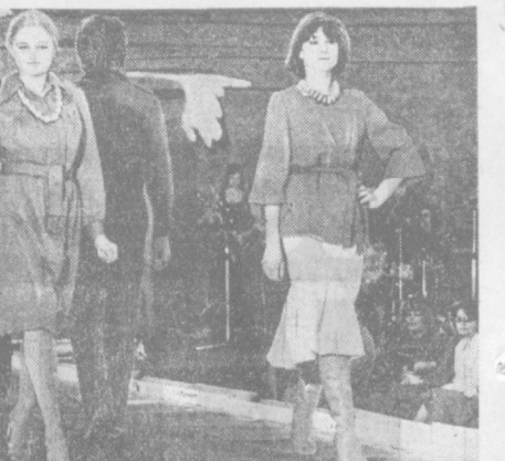
Юбки, блузки, платья для женщин и девушек, брючные костюмы, пальто, куртки, спортивные одежды и другие изделия представлены на выставке «Полная мода и музыка», открывшейся в Ташкенте. Выставку проводит польское внешнеэкономическое объединение «Тевстильимпекс».

Однако не все коллективы взяли те рубежи, которые намечались в начале года. Так, труженники масложирного комбината брали обязательство выдать продукции сверх плана первых трех месяцев на 250 тысяч рублей. Фактически дополнительно к заданию реализовано изделий лишь на 88 тысяч рублей. Напротив, меньше против принятых обязательств выдала продукция фабрика парфюмерно-косметических изделий. Ниже своих возможностей поработали труженники заводов «Ташкенткабель», экскаваторного, лакокрасочного, «Эталон», мезельного № 3. Только в Куйбышевском районе не справились со своими обязательствами десять коллективов предприятий. В результате в целом индустрия района недодала к принятым обязательствам изделий на 984 тысячи рублей. Вместе с тем следует подчеркнуть: в этом районе нет отстающих предприятий.