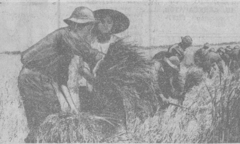
ЮЖНЫЙ ВЬЕТНАМ. Бойцы Народных вооруженных сил помогают крестьянам убирать весенний урожай риса. Фото ВИА—ТАСС.

Около 500 детей геологов и горняков Ташкента, Алмалыка, Ангрена, многочисленных экспедиций и партий Министерства геологии Узбекской ССР выехали гулки на катерах» по Чарвакскому водохранилищу, увлекательные горные походы, спортивные соревнования и, конечно, пионерские костры. В первые дни отдыха они примут участие в торжественной линейке, посвященной 30-летию Победы советского народа в Великой Отечественной войне. Всего за лето в пионерлагере отдохнут 1.500 ребят. Е. ХОРВАТ.