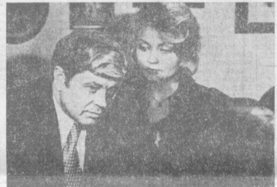
Производство киностудии «Мосфильм».

Комическая и в то же время грустная история о том, как честный и симпатичный мистер Мак-Кинли, мелкий служащий некоей вымышленной страны, задумал сбегать в отдаленное будущее, предполагая, что лишь там он сможет устроить свое личное счастье.