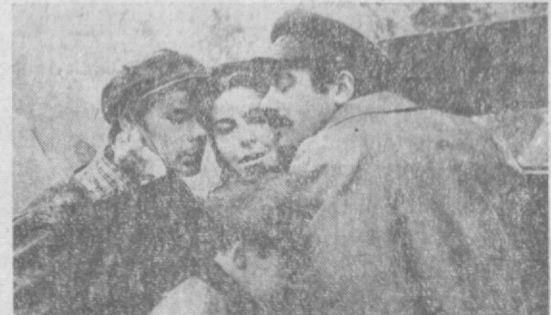
Производство киностудии им. Александра Довженко.

Второй фильм трилогии о партизанском движении на Украине в годы Великой Отечественной войны. В его основе — рассказ о рейде по правобережной Украине знаменитого партизанского соединения С. А. Ковпака, о его борьбе с фашистами.