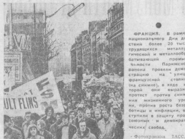
СО ВСЕХ КОНЦОВ ПЛАНЕТЫ