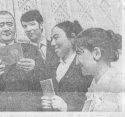
Вся жизнь впереди

Вашим делом и продолжено вашим отцом. Будьте верными сыновьями и дочерьми самой прекрасной страны на планете.