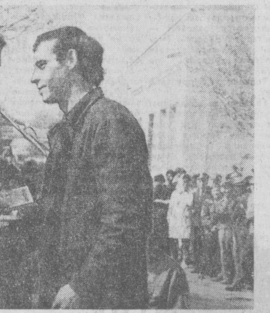
Беседа с пришедшими к нам на практику учащимися ГПУ, а именно вспомни первые годы, когда пришел на завод, вспомни, как выполнялись тогда производственные процессы. Разве сравнить те условия, которые были здесь 40 лет назад! Многие работы выполнялись вручную. Теперь же картина совсем иная. Надо сказать, что и специалисты, стов местной национальности в то время было очень мало. Теперь только в нашем цехе их число увеличилось в пять раз.

Коллективный корреспондент «Вечернего Ташкента» — редакция газеты «Гудок красновосточника».