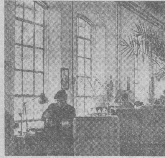
Сегодня в цехах Ташкентского тепловозового-ремонтного завода. Из маленьких железнодорожных мастерских он превратился в крупное предприятие, оснащенное современным оборудованием.

НА СНИМКАХ: слева — участок инструментального цеха, справа — дизельный цех завода.