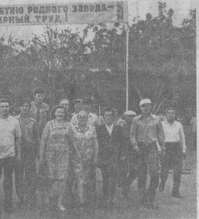
Идет смена на вахту ударную.