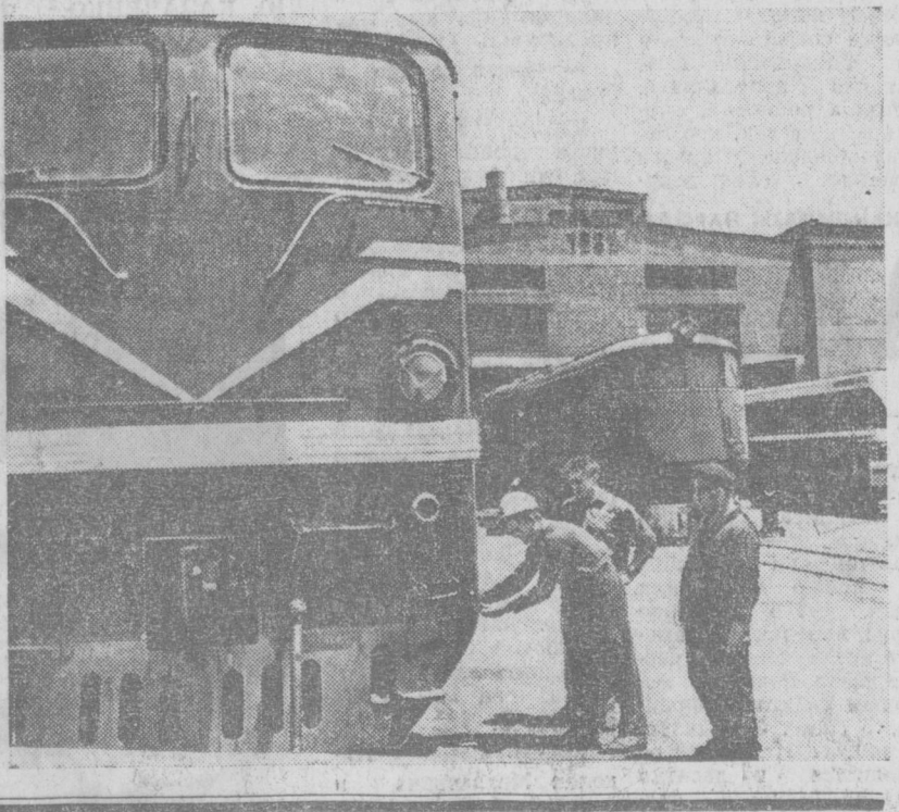
Районные комитеты партии, первичные партийные организации трудовых коллективов города ведут настойчивую работу по закреплению достигнутых успехов и еще шире развертывают социалистическое соревнование за достойную встречу XXV съезда КПСС.

В июльские дни 1913 года в Ташкентских железнодорожных мастерских была образована первая партийная ячейка, что явилось осязаемым политическим событием в жизни завода.