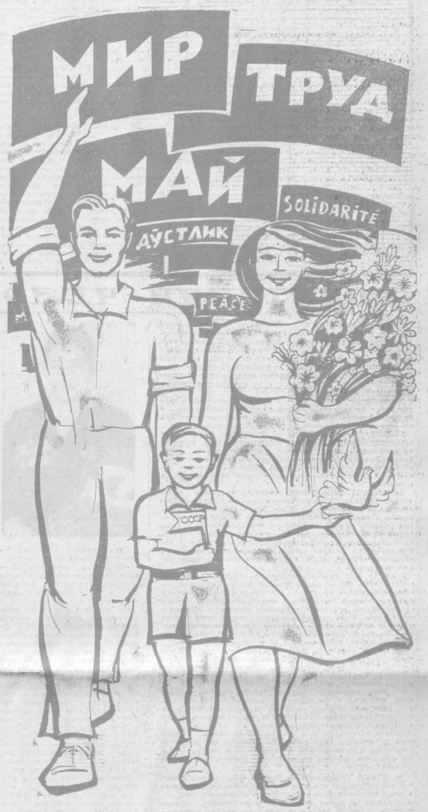
Рис. А. Багдасарян.

В первом году десятилетия коллектив предприятия выпустил более 9 миллионов метров ткани отличного качества.