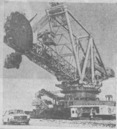
НА СНИМКЕ: роторный экскаватор «ЭРШРД-5.000». Его вес — 8 тысяч тонн.

КАЗАХСКАЯ ССР. В угольном разрезе «Богатырь» объединения «Энибастууголь» готовятся к промышленным испытаниям роторный экскаватор производительностью 5.000 тонн угля в час. Гигантская машина создана на Ново-Краматорском машиностроительном заводе.