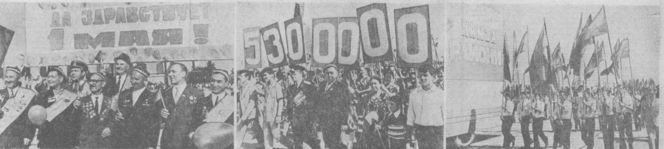
НА СНИМКАХ: в праздничных колоннах.