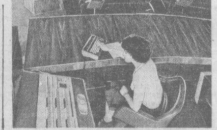
ЦЕНТРАЛЬНЫЙ ДИСПЕЧЕРСКИЙ ПУНКТ ЕДИНОГО ЭНЕРГЕТИЧЕСКОЙ СИСТЕМЫ СССР

НОРИЛЬСК. Рентгеновские лучи стали надежными помощниками специалистов Норильского горно-металлургического комбината. Здесь на никелевом заводе начала действовать система рентгеноспектрального анализа во всех звеньях технологического процесса — от поступления руды до превращения ее в металл. 15 минут требуется теперь, чтобы определить в сырьевом металле наличие любого из двенадцати компонентов. (ТАСС).